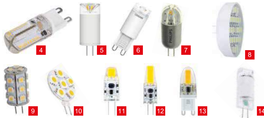
呈現各系列特徵的產品圖