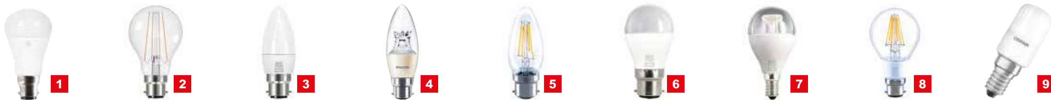
呈現各系列特徵的產品圖