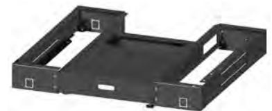
ANTIVUELCO / STABILIZER / ANTIRETOURNEMENT