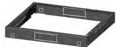
ZÓCALO / PLINTH / PLINTHE

F Fabriqué en acier d'une épaisseur de 2 mm. Hauteur standard: 100 mm. Possibilité de le fixer au sol ou de monter des pieds ou des roues. Finition: gris graphite. Emballage: 1 socle, éléments de fixation.